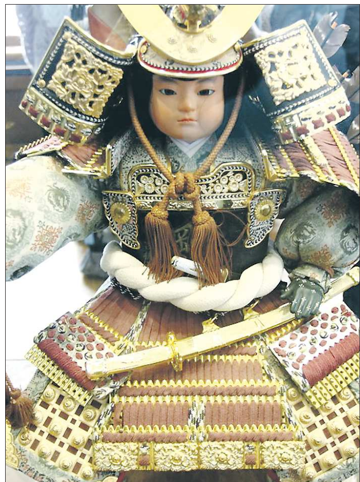
Кукла «Самурай». В реальной жизни самураи были не только воинами-рыцарями, но и телохранителями знатных господ