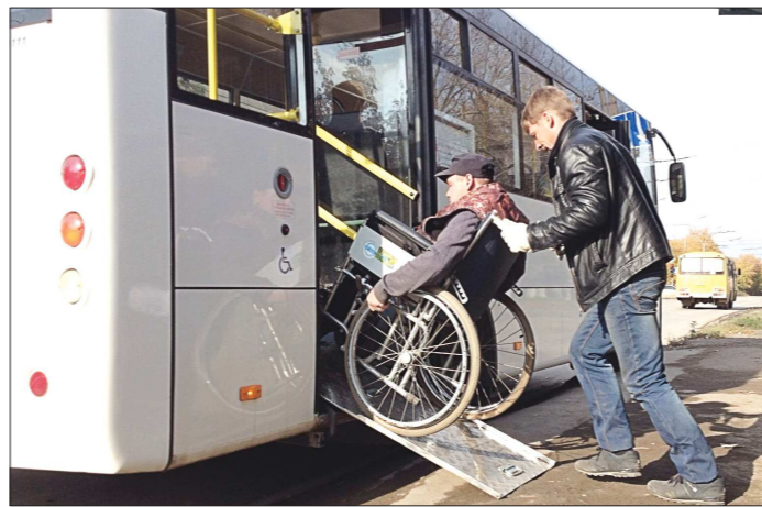
Инвалиды-колясочники без труда попадают в автобус благодаря выкидному трапу

бы в любой ситуации развернуть трап быстро и не создавая неудобств остальным пассажирам. В управлении социальной политики по Каменскому району и Каменску-Уральскому сообщили, что это частная инициатива компании «Экспресс-сити», и к государственным или областным программам