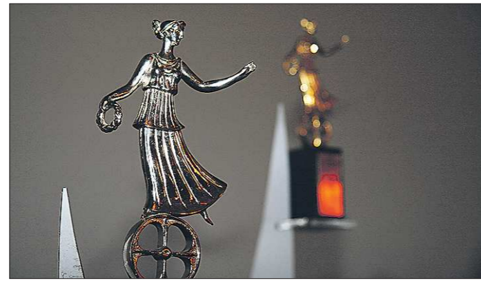
Впервые обладатель главного приза получит ещё и грант на съёмку нового фильма. Сумма пока держится в секрете

в соцсети и каждый день общается: «Я проснулся, вот моя чашка кофе»... Другое — если это попытка рассказать о себе ещё что-то, что будет значительно интереснее и содержательнее, чем лишь ты сам. Этот жанр любопытен ещё и потому, что найдёт отклик у молодого зрителя.