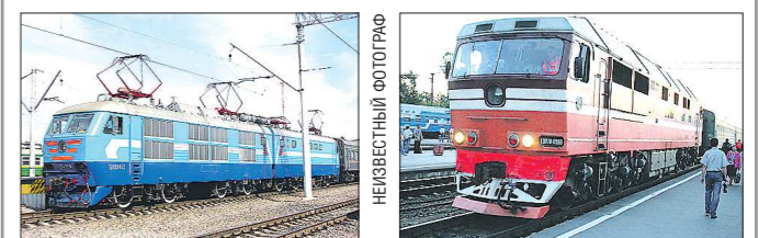
На железных дорогах России до сих пор используются как электровозы так и тепловозы