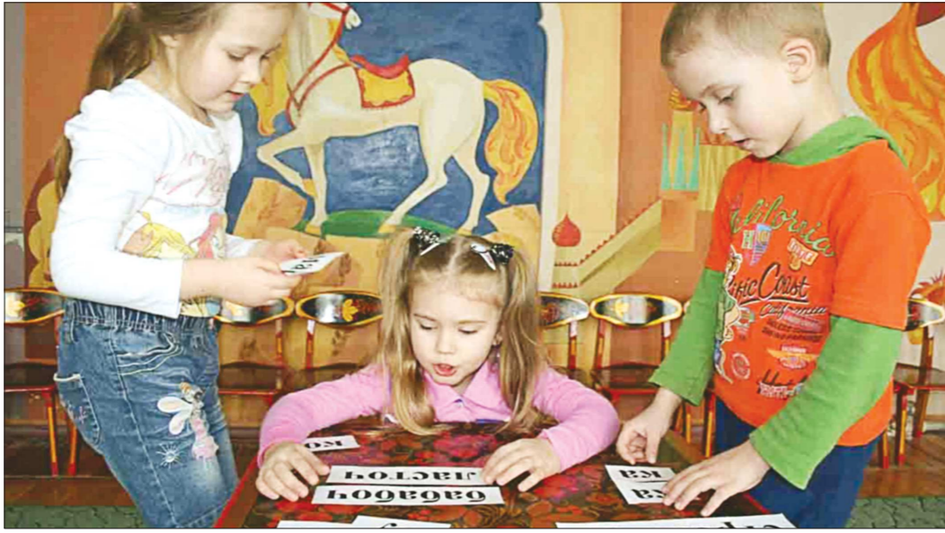
Дети растут, играя, и грамоте тоже обучаются в игре

Надо сказать, что в моём советском детстве так и было: никто не учил в садике буквам — это и не требовалось, грамоте успешно учили в школе. Но сейчас реальность отличается от того идеального мира, к которому нас отсылает закон. Нынешние сады ввели обучение чтению вовсе не потому, что воспитатели так захотели! Просто школы стали работать по-другому. Даже нынешняя «Азбука» составлена