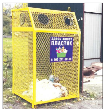
Этот контейнер появился во дворе дома на улице Агрономической, 7 в числе первых

— Почему пилотным стал именно Чкаловский район?