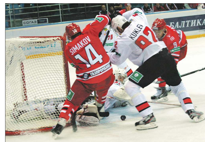
«Автомобилист» бросил по воротам соперника вдвое больше (76 против 37 у гостей), но победить опять не смог