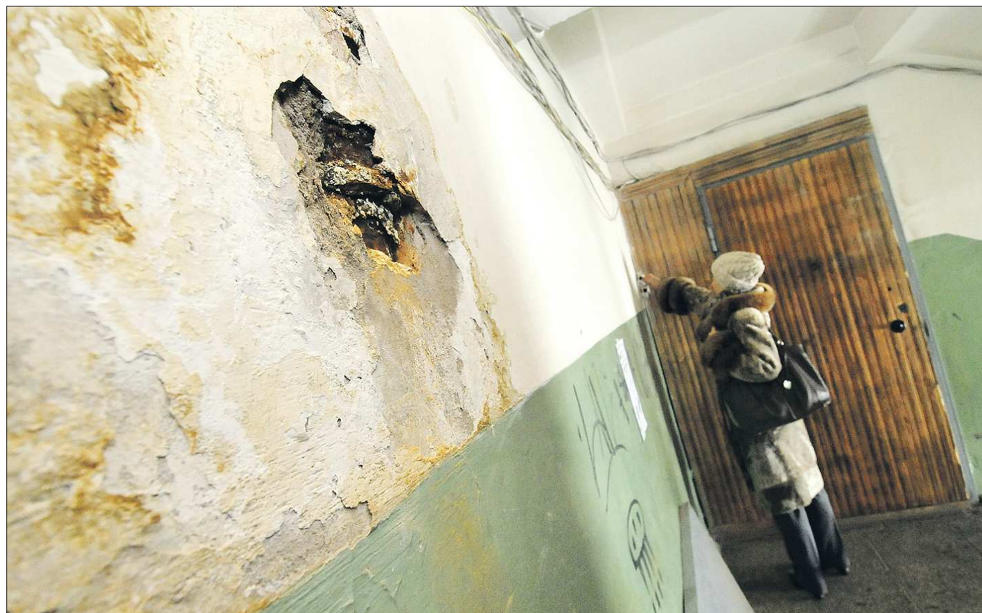
И такие дома могут преобразиться при должном внимании жильцов

Все эти факты подтверждаются постановлением Чкаловского районного отдела судебных приставов города Екатеринбурга, а теперь и решением судебной коллегии по гражданским делам Свердловского областного суда. «Доводы о том, что ООО «Управляющая компания РЭМП УЖСК» не составлена смета капитального ремонта опровергнуты представленными актами приёмки выполненных работ со сметными расчётами. Отсутствие общей сметы на капитальный ремонт... прав и законных интересов заявителя не нарушает», — отмечается в последнем документе. Там же говорится, что замена сливных труб и оконных блоков не входила в обязанность УК. Кроме того, уточняется, что отопительные радиаторы и разводка горячего и холодного водоснабжения в квартирах жилого дома не являются общим имуществом, и обязанность по их содержанию и ремонту лежит на собственниках жилья в соответствии с Гражданским кодексом РФ.