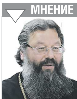
КИРИЛЛ, митрополит Екатеринбургский и Верхотурский

+/- — рост / падение по отношению к предыдущему показателю