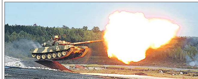
Танк Т-90 с полигона «Старатель», 2011 год