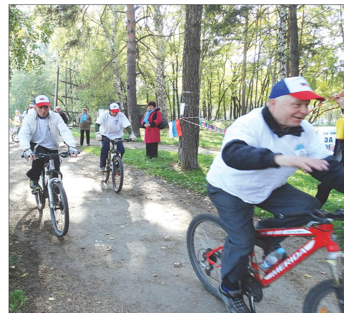
Велогонки в осеннем лесу — отличный заряд бодрости