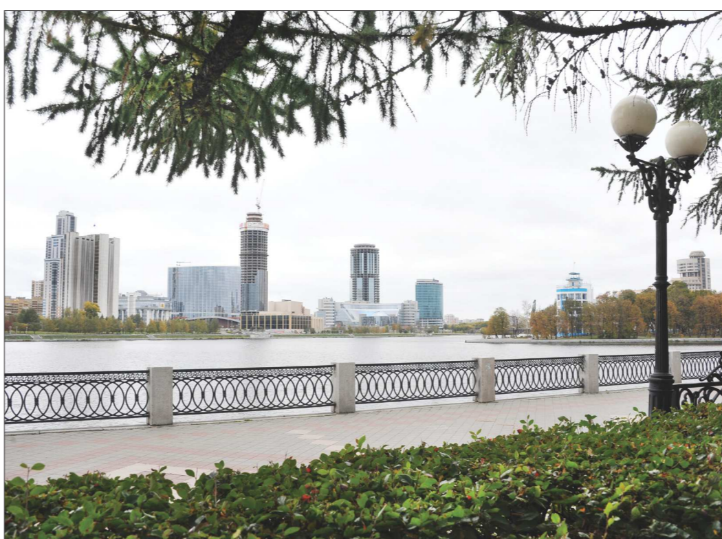
По числу высотных зданий Екатеринбург вышел на первое место среди региональных городов-миллионников. Одна из причин – дефицит свободной земли и чрезвычайно высокая цена на неё

Но, оказывается, Екатеринбург есть чем ответить Грозному. В настоящее время у нас ведётся активная подготовка к строительству двух 61-этажных жилых небоскрё-