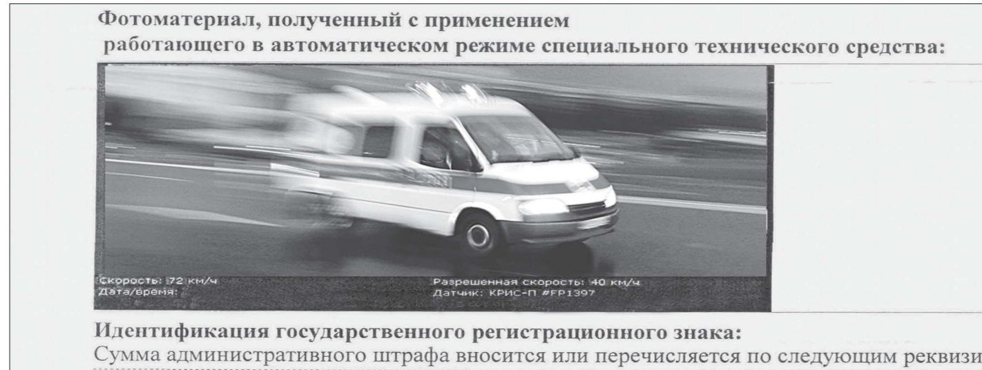
Фотоматериал, полученный с применением работающего в автоматическом режиме специального технического средства: