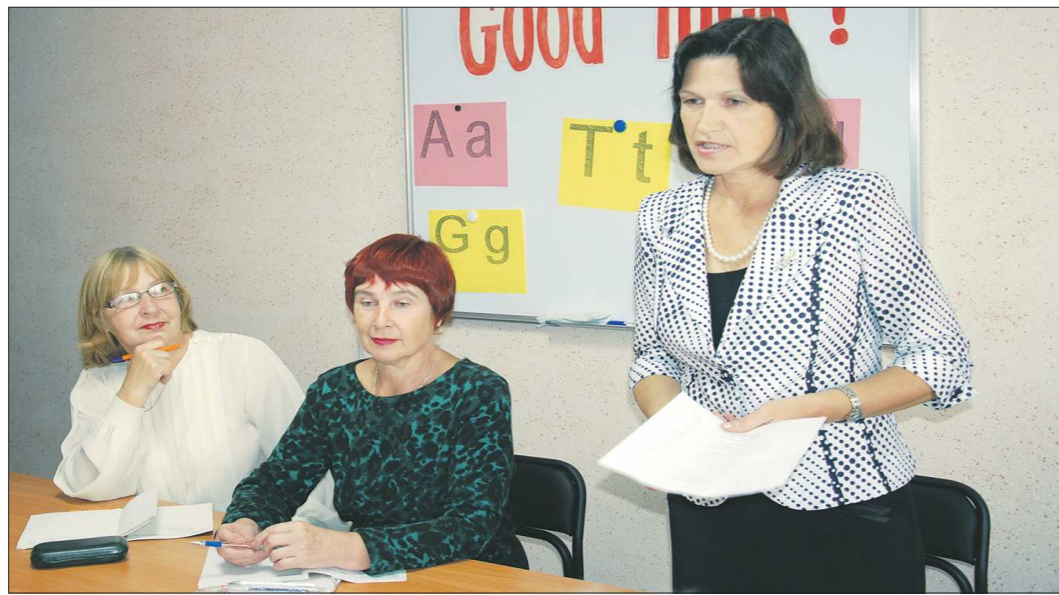
В группе нет ни одной ученицы, которая была бы так или иначе знакома с английским языком — в школе все изучали немецкий или французский