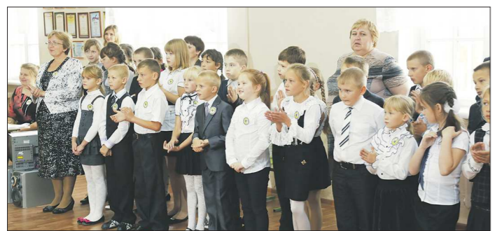
Линейка запоздала всего на две недели

На первых этапах ремонта дождливая погода вносила неприятные коррективы в график. Но, закончив операции на крыше, подрядчики ускорились. Решили, что тянуть до ноября не будут. Разве это дело — дети отстанут в обучении на целую четверть. На финише к подрядчикам присоединились учителя, родители, старшеклассники. Мыли полы, расставляли мебель, развешивали шторы. В итоге 11 сентября комиссия управления образования приняла школу. И в понедельник ученики наконец-то собрались на торжественную линейку.