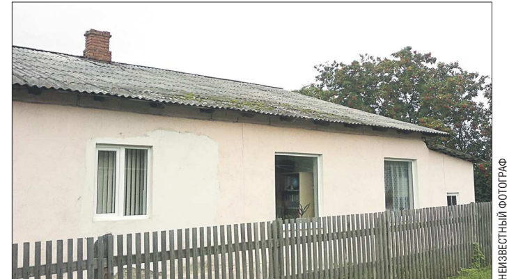
Сысертский районный суд принял решение закрыть этот садик на 90 дней

Детский сад №50 в деревне Шайдурово Сысертского района закрыт из-за нарушения санитарных норм, сообщает управление Роспотребнадзора по Свердловской области.