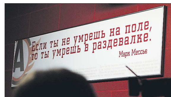
Слова канадского хоккеиста Марка Мессье стали девизом «Автомобилиста». Этот плакат висит на выходе из раздевалки нашей команды