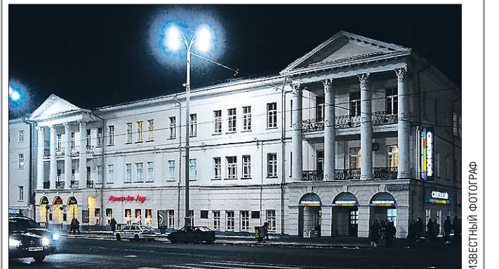
Музыкальному вузу был выделен старейший каменный дом Екатеринбурга, где когда-то располагалась Консистория — канцелярия Главного управления Уральских горных заводов (современный адрес — улица Ленина, 26)