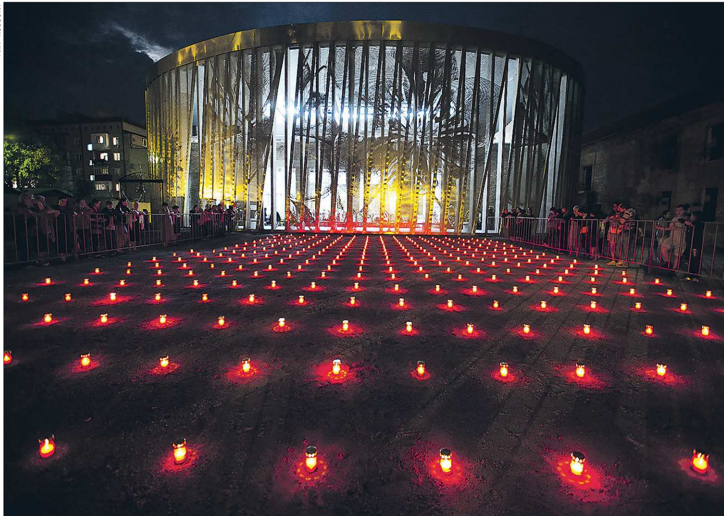
За десять лет, прошедших со дня бесланской трагедии, сложился свой траурный обряд. В первые дни сентября жители Беслана и многих городов страны приносят живые цветы, пластиковые бутылки с водой и зажигают свечи

1 сентября 2004 года в городе Беслан в школе № 1 были захвачены в заложники ученики, их родители и учителя. В течение двух с половиной дней террористы удерживали в заминированном здании более 1 100 человек. 3 сентября в школе произошли взрывы, после которых заложники начали выбегать из здания, и террористы открыли по ним огонь. Федеральными силами был предпринят штурм. Большинство заложников были освобождены, но 334 человека (в том числе 186 детей) погибли.