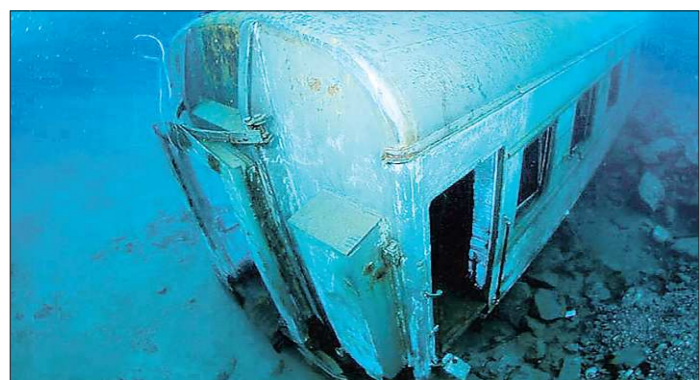
Это фото в соцсети стало поводом для прокурорской проверки