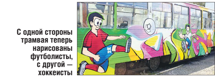
С одной стороны трамвай теперь разрисовали футболисты, с другой — хоккеисты

ГОСУДАРСТВЕННОЕ БЮДЖЕТНОЕ УЧРЕЖДЕНИЕ СВЕРДЛОВСКОЙ ОБЛАСТИ «РЕДАКЦИЯ ГАЗЕТЫ "ОБЛАСТНАЯ ГАЗЕТА"». ОБЩЕСТВЕННО-ПОЛИТИЧЕСКОЕ ИЗДАНИЕ