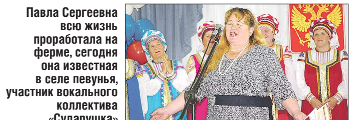
Павла Сергеевна всю жизнь проработала на ферме, сегодня она известная участница вокального коллектива «Сударушка»

— Я учился в колледже на педагога по адаптивной физкультуре. Многие дети, которые приходят в секции, имеют те или иные отклонения. Нужно уметь просчитывать нагрузку для них. Спелеология в детстве и полученная специальность — это два фактора, которые очень помогают в работе. Первая научила замечать интересные вещи, вторая — оценивать физические способности людей и делать эти вещи для них доступными.