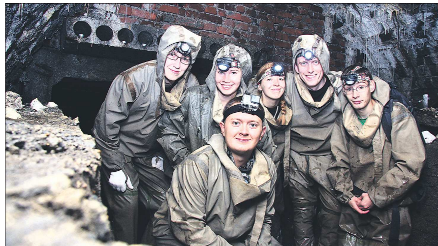
Через полчаса пути - остановка у подземного моста. Диггеры называют это место «сталактитовым гротом» и для антуража расставляют здесь свечи. Романтика ещё та

замерзает, только вода чуть холоднее. Наш маршрут от цирка до зоопарка — самый короткий и простой, около полутора часов туда-обратно. Ильдар рассказывает о них и знакомые диггеры, изучая этот тоннель, вышли из люка в зоопарке, их тут же окружили испуганные сотрудники, но, узнав, кто они такие, посмеялись и пообещали поставить на это место клетку с тигром. Люк после этого заварил.