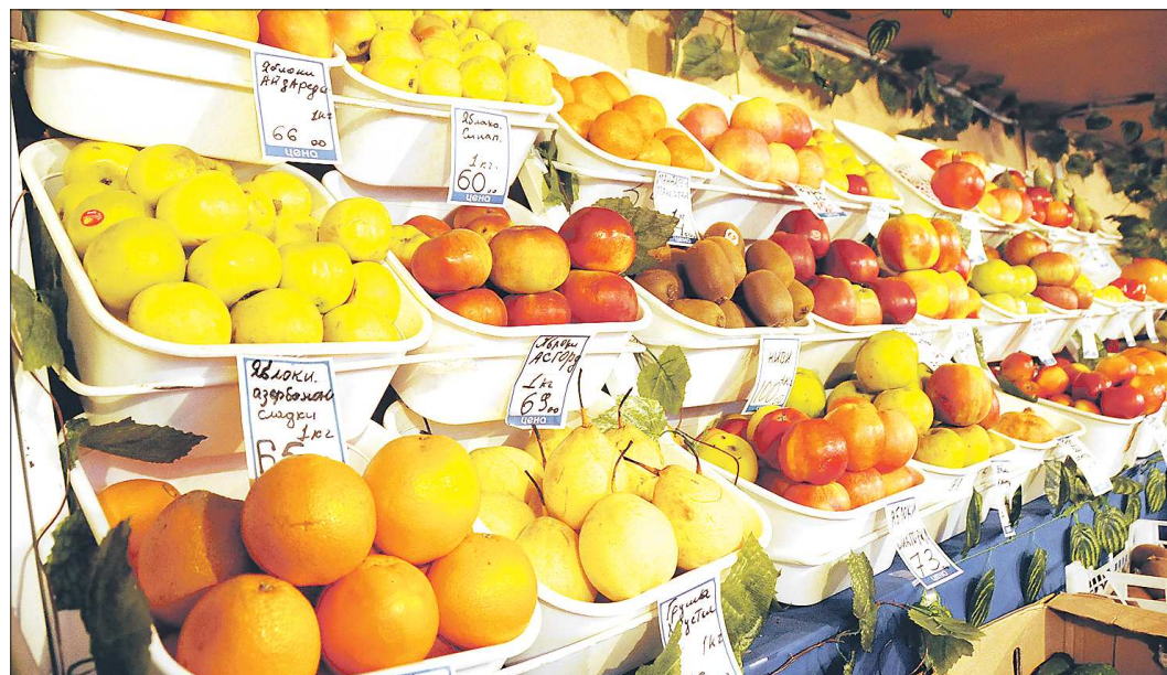
Фруктовые прилавки не опустеют. На смену польским, итальянским яблокам, голландским грушам придёт продукция с юга России, из Сербии, Южной Америки