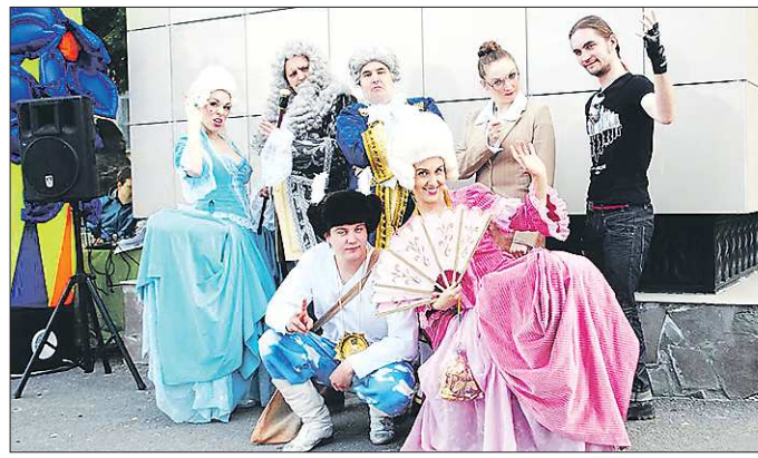
На этом фото участники группы «Демидов-стиль» (их трое, они на переднем плане) — вместе с актёрами молодёжного театра Нижнего Тагила. Трек «Неизвестная история» можно послушать на сайте oblgazeta.ru

Записали Зинаида ПАНЬШИНА, Дарья БАЗУЕВА, Галина СОКОЛОВА, Елизавета МУРАШОВА, Дмитрий СИВКОВ.