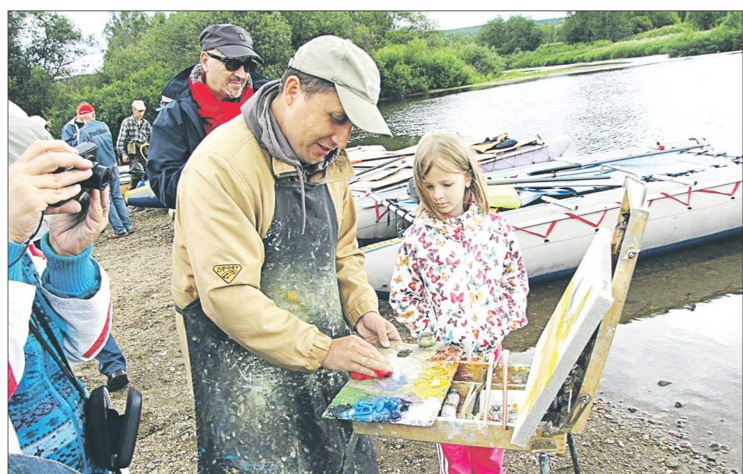
Фестиваль «Арт-Чусовая» впервые прошёл в этих краях в 2012 году

В эти дни в Староуткинске проходит III Всероссийский фестиваль-пленэр «Арт-Чусовая». На берег реки Чусовой в этом году съехались без малого сорок художников, представляющих весьма обширную географию: Санкт-Петербург, Казань, Омск, Челябинск, Уфа, Пермь, Альметьевск и близлежащие Екатеринбург и Нижний Тагил. Куратором нынче выступило Нижнетагильское городское отделение Союза художников России. Организатор прежний – творческое объединение «Арт Сфера».