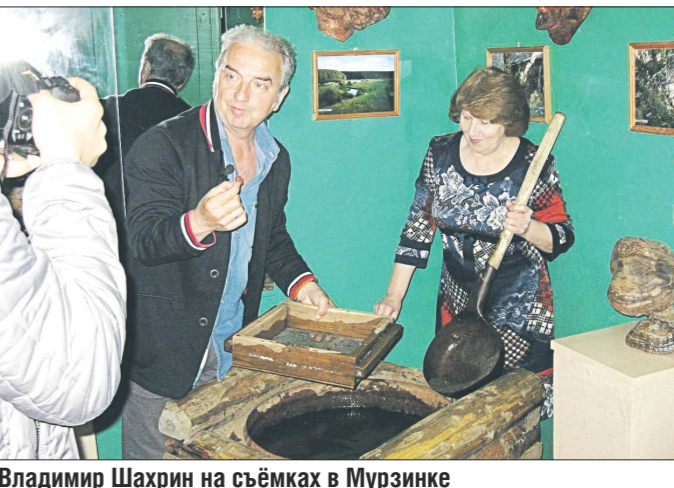
Владимир Шахрин на съёмках в Музкинге

В рамках экспедиции съёмочная группа посетила девять музеев, от областного краеведческого до Минералогического музея им. А.Е. Фермана в селе Музкинга. Владимир Шахрин поблагодарил уральские музеи за помощь и оставил им на память записку: «Уральские музеи самые любимые музеи мира! Потому что родные!». В фильме Владимир Шахрин призывает свердловчан любить свой край. «Уверен, что большинство уральцев в глубине души понимают, что у нас есть что посмотреть, но всё время откладывают такое путешествие на потом. Поэтому одна из наших задач – поднять людей с дивана, дать им новый стимул открывать для себя родной край», – отмечает Владимир Шахрин.