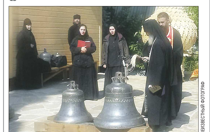
В строящемся в Екатеринбурге по улице Раевского храме князей Святых Бориса и Глеба были освящены 14 колоколов, прибывших из города Тутаев Ярославской области, где они отливались. Вес самого большого из этих колоколов — 3,5 тонны