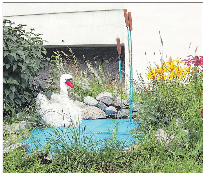
Чудо-лебедь — и не сразу поймёшь, что сделан из обычных ёршиков для мытья посуды

мент требовалось 120 тысяч. Остальные средства выделили стекольный и мотоциклетный заводы, местная администрация и Министерство культуры РФ. Вот так Ирбит стал первым российским городом, в котором появился памятник Жукову в полный рост, до этого момента в стране ему были установлены только бюсты. В пятидесятые годы Жуков был в опале у руководства страны, и многие из них не испугало, и на первых после войны выборах в Верховный Совет СССР они попросили полковника баллотироваться по Ирбитскому избирательному округу № 290. Став депутатом, Жуков не раз приезжал в Ирбит и в дальнейшем сделал многое для благоустройства этого старинного города — при его поддержке был построен северный мост через реку Ирбит, заасфальтированы улицы, увеличен автобусный парк, изысканы средства на восстановление драматического театра после пожара... Сегодня в Ирбите осталось всего чуть более 50 участников войны, и многие из них по состоянию здоровья уже не смогли прийти на митинг, посвящённый двадцатилетию памятника. Но пришли их дети, внуки и правнуки.