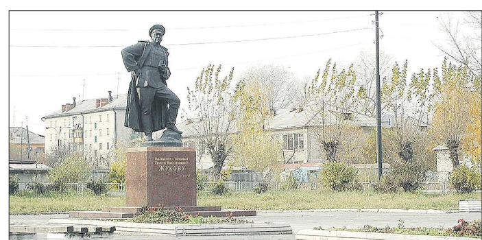
Памятник Г. К. Жукову в Ирбите. Скульптор Л. Кербель. Высота фигуры — три метра. Открыт 21 июля 1994 года