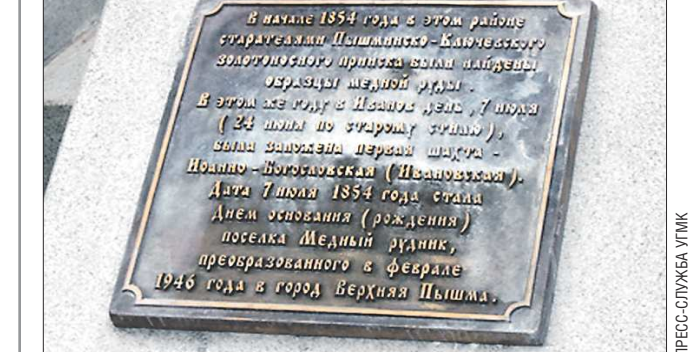
Надпись на табличке: «В начале 1854 года в этом районе старателями Пышминско-Ключевского золотоносного прииска были найдены образцы медной руды. В этом же году в Иванов день, 7 июля (24 июля по старому стилю), была заложена первая шахта — Иоанно-Богословская (Ивановская). Дата 7 июля 1854 года стала датой основания поселка Медный рудник, преобразованного в феврале 1946 года в город Верхняя Пышма»