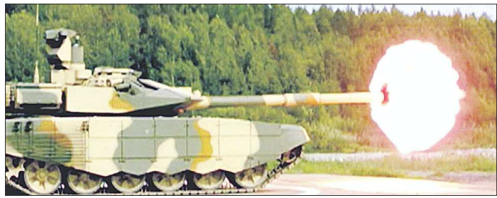
Герои фильма «Танки. Уральский характер» расскажут о легендах и новейших разработках тагильского танкостроения — основы российской «оборонки»