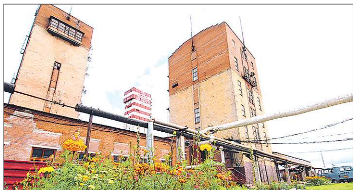
Строительство «Черёмуховской-Глубокой» позволит создать 758 рабочих мест