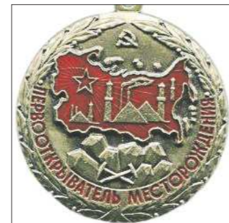
Нагрудные знаки «Первооткрыватель месторождения» имели модификации (справа – нынешний российский знак), но всегда ценились на вес золота

– В 2011 году я получил знак «Первооткрывателя», а вот денег – ни копейки, – рассказывает бывший руководи-