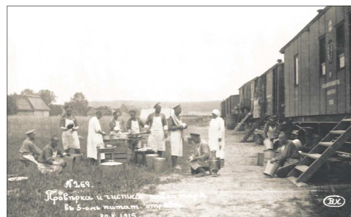
Пятый питательный отряд, проверка и чистка инвентаря, 1915 год