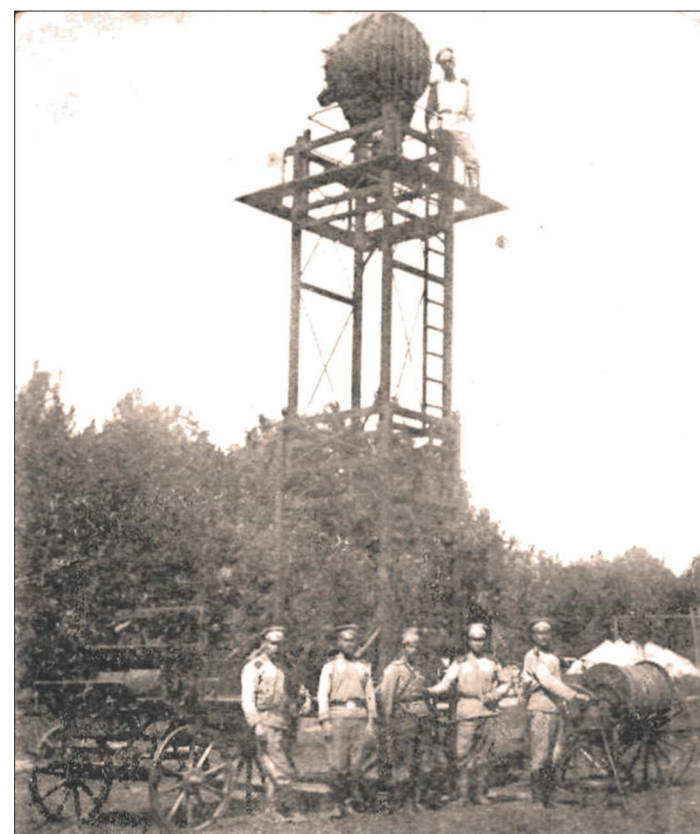
Изобретение Первой мировой – не только танки, пулемёты и отравляющие газы, но и прожектора. Вышка полевого прожектора