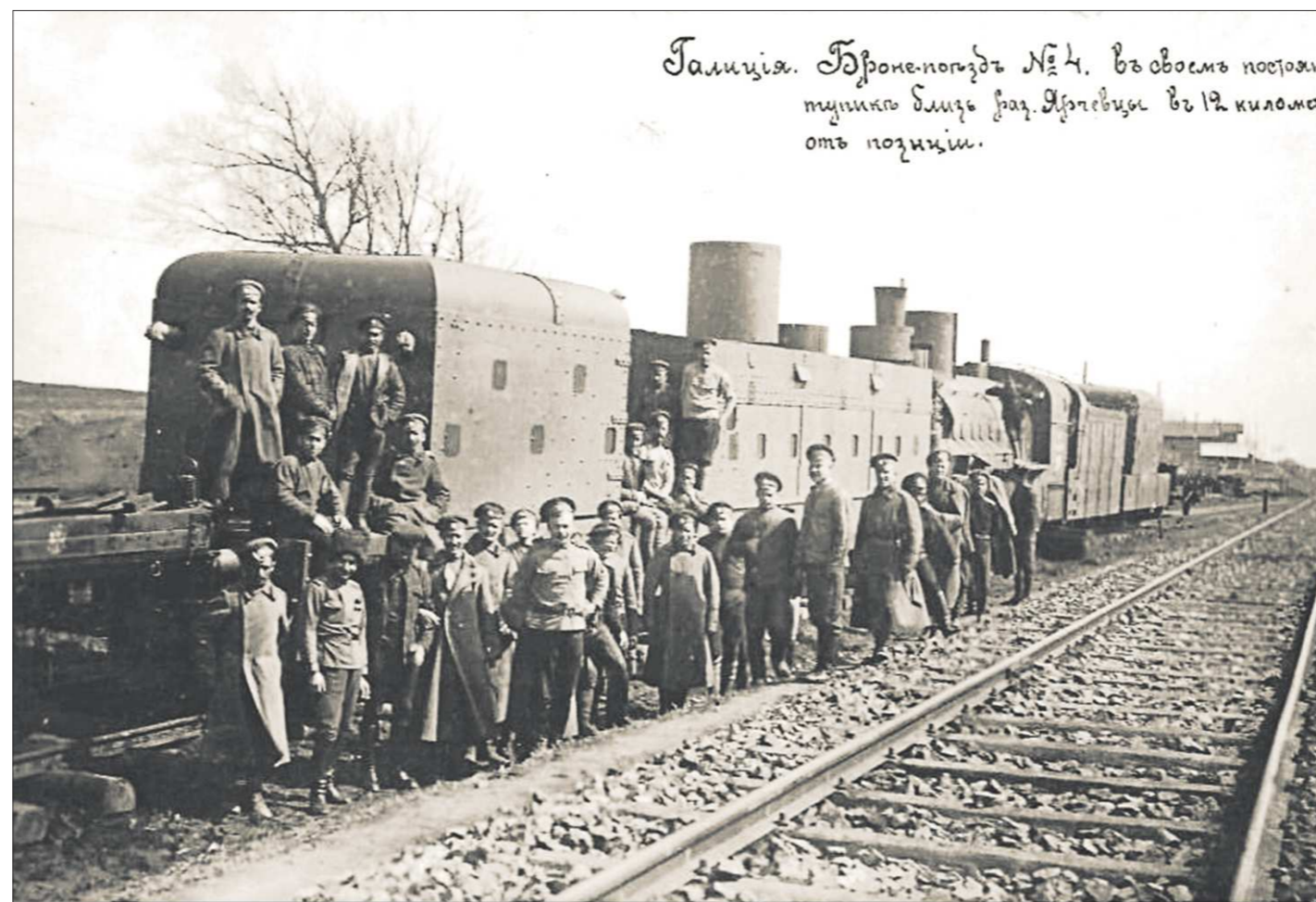
Галиция (современная Западная Украина). Бронепоезд №4 вблизи и разьезда Ярчевцы