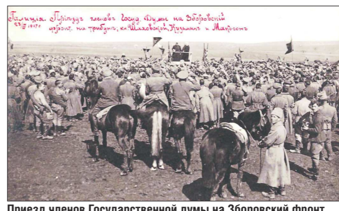
Приезд членов Государственной думы на Зборовский фронт, 1917 год