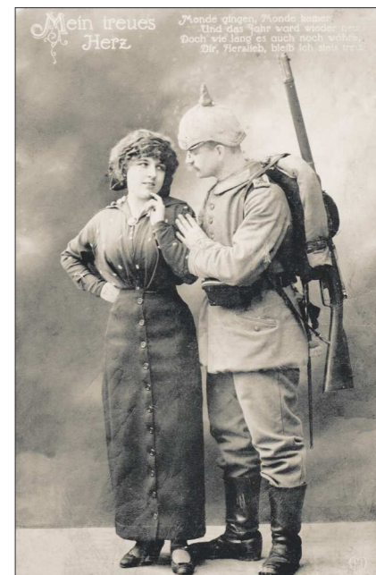
В противоположность русским, немецкие солдаты изображались такими вот галантными кавалерами