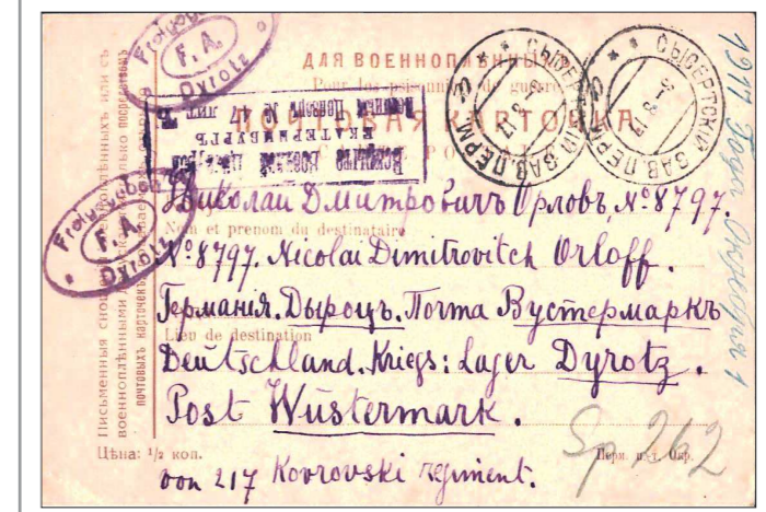
Образец почтового отправления из лагеря Дыроц (Германия)