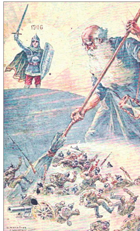
Начало войны Россия встретила всплеском патристизма

На более поздних открытках стали изображать оружие, полковые соединения, даже быт солдат, но при этом полностью игнорировались тяготы сражений и последствия ранений, в отличие от иностранных, французских, например, где одними из самых продаваемых стали открытки с изображением ослепших ветеранов.