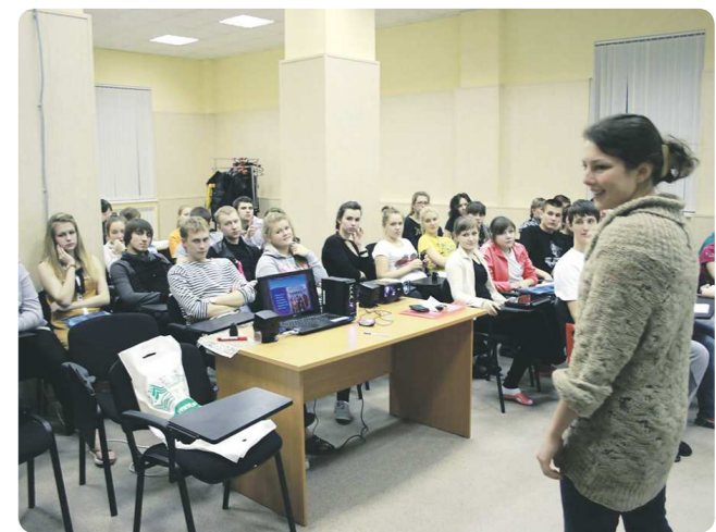
Собрания в клубе проходят каждый второй четверг месяца в 16:00 на Ленина, 51, аудитория 342