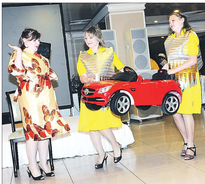
Уральские продавцы считают, что в будущем торговые роботы будут любые покупки доставлять прямо на дом покупателю