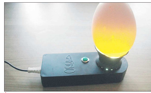
*Овоскоп просвечивает яйцо: у свежего содержимое почти прозрачное, а у старого желток большой, тёмный, приближен к скорлупе, границы его очерчены более резко, белок жидкий, поэтому желток очень подвижен