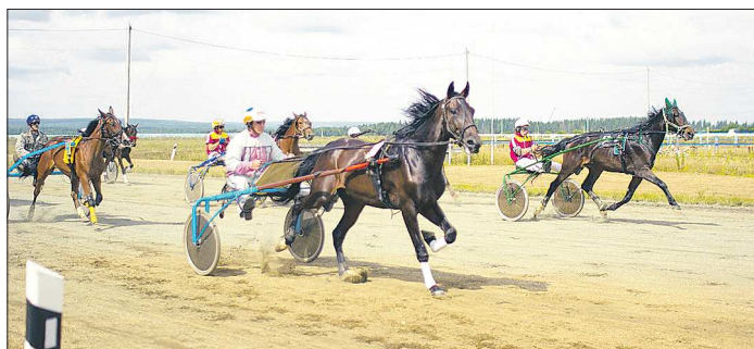
Висимский ипподром открылся в 2009 году. Беговой сезон на дорожке в 1 600 метров начинается в мае и заканчивается осенью