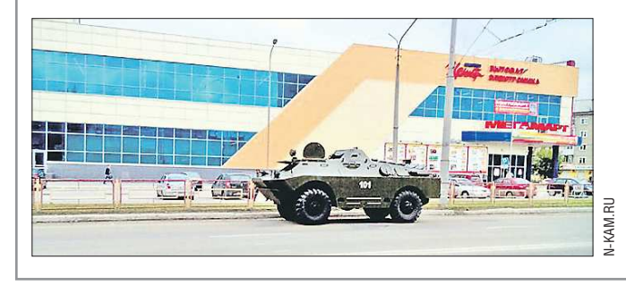
Н. КАМ. RU

Возле одного из продуктовых супермаркетов Каменска-Уральского припарковалась боевая разведывательно-дозорная машина. Как сообщает портал n-kam.ru, за городом проходили учения, куда, скорее всего, и направлялась военная техника. Видимо, члены экипажа проголодались и решили сделать остановку.