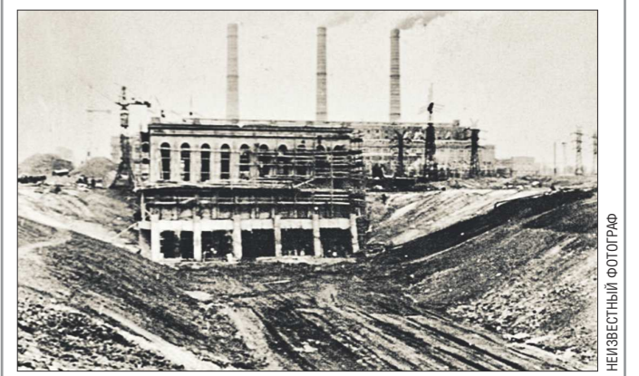
Строительство береговой насосной станции ГРЭС, 1955 год