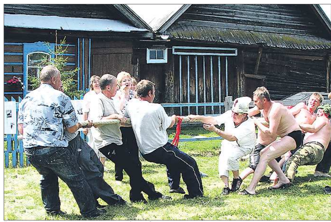
Главный «аттракцион» — народные забавы. Соревновались улица на улице: галашане перетягивали канат, пилили брёвна на скорость, таскали воду и косили траву