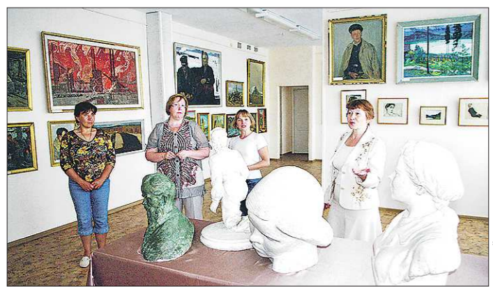
18 лет картины и скульптуры колхозной галереи демонстрировались только на временных выставках, а сейчас в селе Чусовое открыта постоянная экспозиция

В Верхней Пышме в День металлурга появились «живые» скульптуры: «медные», «золотые» и «серебряные»