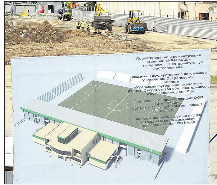
На «Уралмаше» демонтировано административное здание и часть трибун, срыт футбольный газон. Новая арена должна быть готова не позднее 15 мая