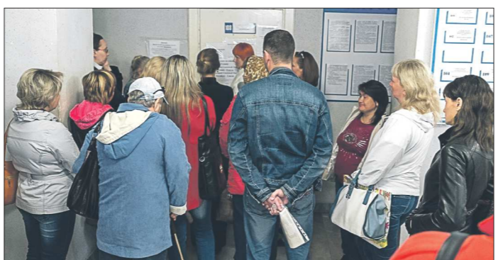
Чтобы заполнить освободившиеся путёвки в детский лагерь, каменским родителям пришлось занимать очередь с вечера

Во исполнение приказа ФАС России от 23.12.2011 г. № 893 ОАО «Екатеринбурггаз», как субъект естественных монополий, оказывающий услуги по транспортировке газа, публикует информацию за I кв.2014 г. на официальном сайте общества — www.ekgas.ru .