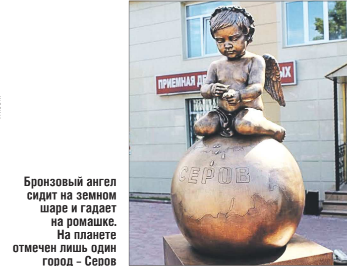
Бронзовый ангел сидит на земном шаре и гадает на ромашке. На планете отмечен лишь один город — Серов

Подарком к Дню города серовчанам стала «Книга желаний» и ангел, гадающий на ромашке. Как пишет серовская газета «Работа и отдых», скульптура «Книга желаний» украсила площадь около Центральной городской библиотеки. На благоустройстве этой площади из городского бюджета ушло около 800 тысяч рублей. Теперь там есть скамейки и урны, парковки для автомобилей и велосипедов, высажены ели и рябины, облагоустроен газон.