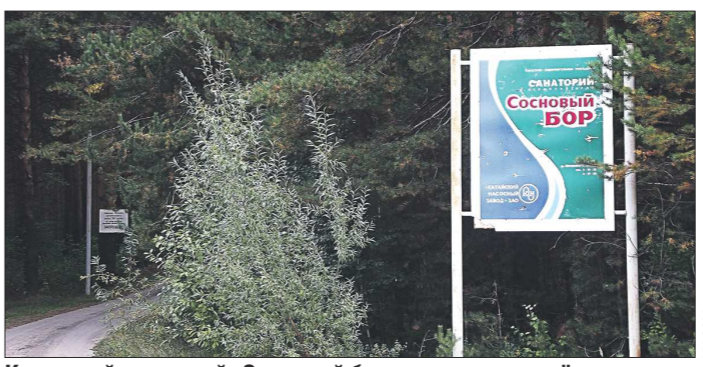
Каменский санаторий «Сосновый бор» — это не пять звёзд, но по популярности, похоже, он может сравниться с лучшими курортами страны

— После формирования основных списков часть желающих от путёвок отказывается или просто за ними не является. В таком случае формируются дополнительные списки — оставшиеся неостребованными путёвки и называются «горящими». О количестве свободных мест Управление образования информирует администрацию и СМИ. Путёвки выдаются за два рабочих дня до начала смены с восьми утра. Свободных мест в лагере каждый раз остаётся разное количество, поэтому предугадать ситуацию заранее невозможно. При всём желании мы от «горящих» путёвок уйти не можем. Некоторые родители поступа-