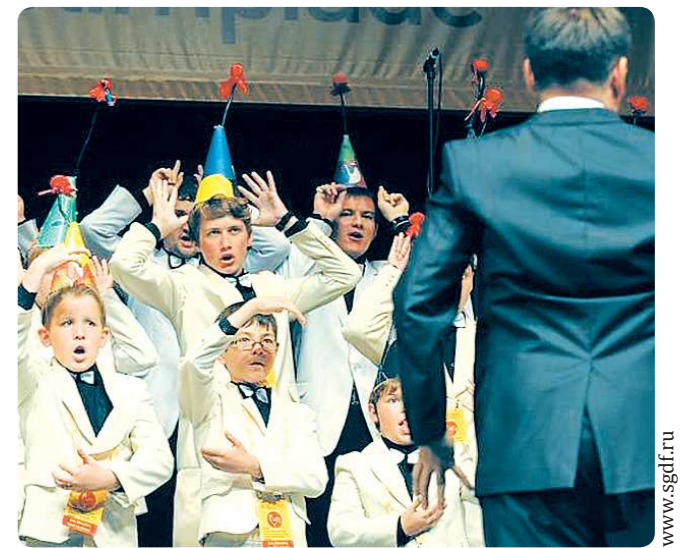
Мужская капелла Детской филармонии в составе 43 юных вокалистов в возрасте от восьми до 18 лет завоевала золото в номинации «Хор мальчиков» на крупнейшей Всемирной хоровой олимпиаде, которая прошла в Риге. Соперниками наших ребят были 27 тысяч певцов (около 460 хором) из 73 стран. Оценивали вокальные данные исполнителей 84 хоровых эксперта, среди которых лишь трое — представители России. Екатеринбургская капелла на 20 баллов обошла своего ближайшего соперника — коллектив из Германии. Всемирная олимпиада хоров (World Choir Games) проводится с 2000 года. За 14 лет это первая победа представителей из нашей страны.