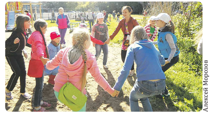
Студенты даже выпустили специальную методичку с правилами игры, которую раздают во время дворовых мастер-классов