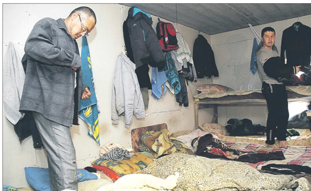
Жильцы-соседи таких «общежитий» вправе создать специальную комиссию и выяснить, сколько человек действительно проживает в квартире

Он обратился в полицию и получил ответ, что это жильё сдаётся без договора, то есть хозяйка не делает никаких налоговых отчислений.