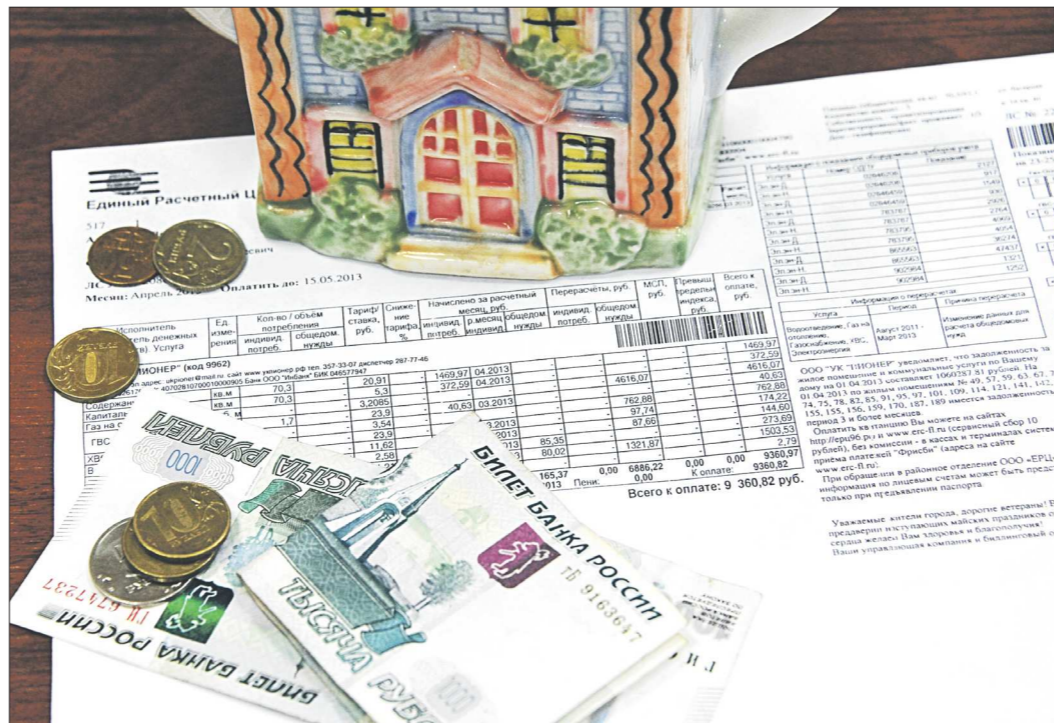
Строка «содержание жилья» включает в себя множество работ и услуг, часть которых некоторые управляющие организации на деле не выполняют

Фактические затраты указывают для того, чтобы сделать перерасчёт. Если установлен УКУТ, а жильцы платили по нормативам, управляющая организация по итогам отопительного сезона обяза-