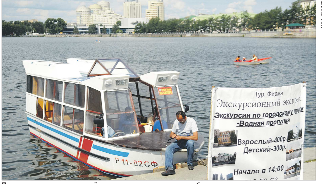
Прогулка на катере — дешёвое удовольствие, но екатеринбуржцев это не отпугивает. Среди горожан есть даже постоянные клиенты