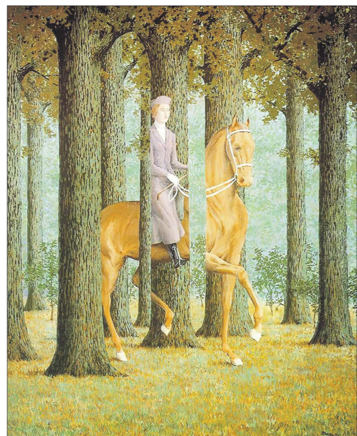
Рене Магритт так писал об этой своей картине: «Видимые вещи могут быть невидимыми. Если, к примеру, некие люди едут верхом через лес, то сначала видишь их, потом – не видишь, но знаешь, что они там. В картине «Карт-бланш» наездница спявляет собою деревья, а они заслоняют ее. Однако наша сила мышления объемлет и зримое, и незримое, и я при помощи живописи делаю мысли видимыми»

В первом туре «Урал» сыграет «ДОМА» против «Мордовии».