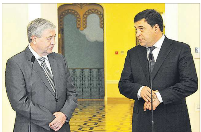
Владимир Семашко и Евгений Куйвашев обсудили развитие сотрудничества Среднего Урала с регионами Белоруссии

В опубликованном в «Областной газете» № 119 (7442) от 08.07.2014 г. объявлении Министерства агропромышленного комплекса и продовольствия Свердловской области вместо фразы с 10 по 10 августа 2014 г. следует читать с 08 по 08 августа 2014 г.