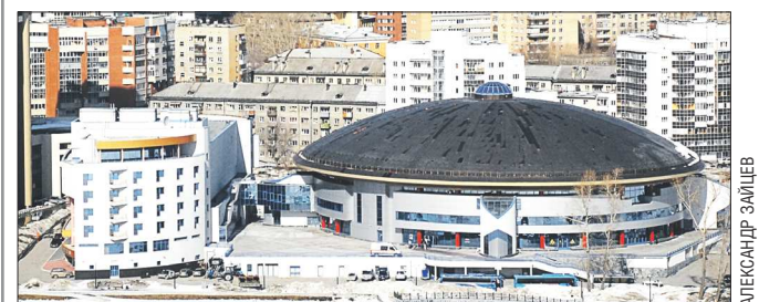
Блок «Б» – это четырёхэтажное здание, соединённое с основной ареной надземным переходом