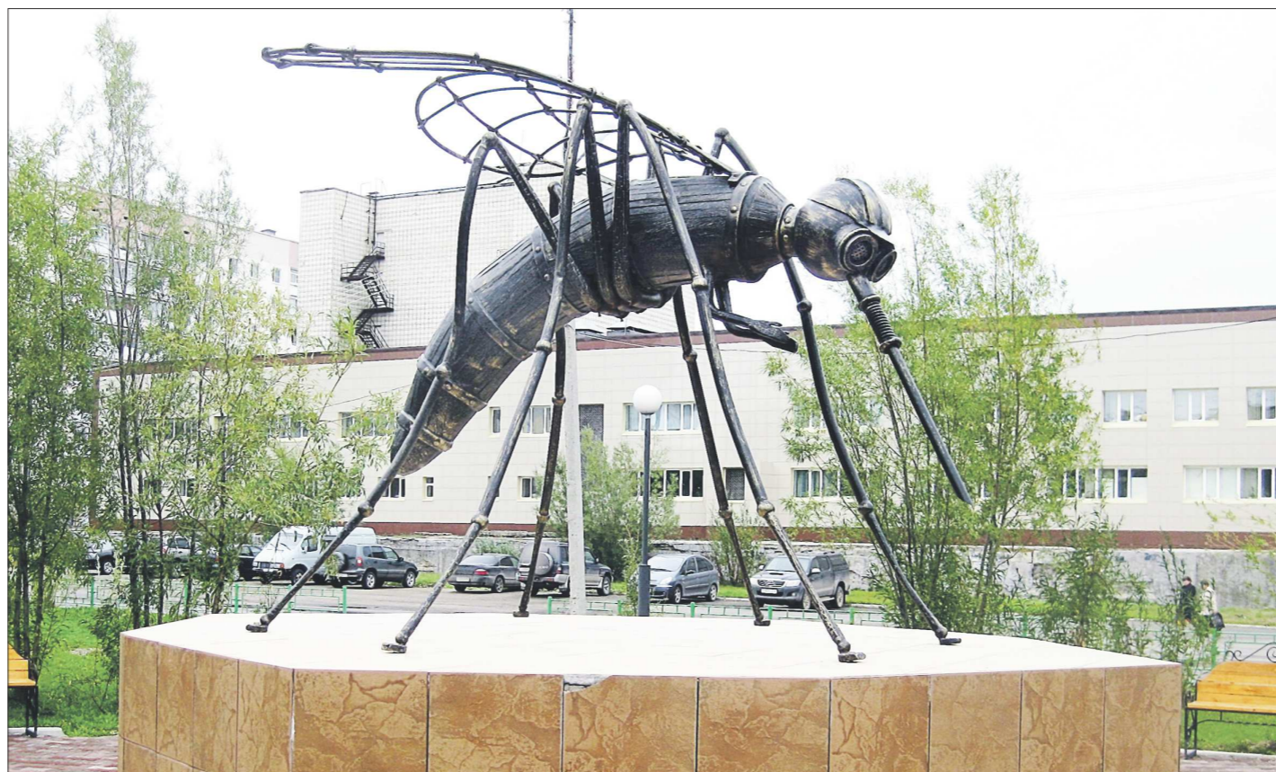
В некоторых городах страны комарам установлены памятники. Этот, например, находится в Усинске (Республика Коми)