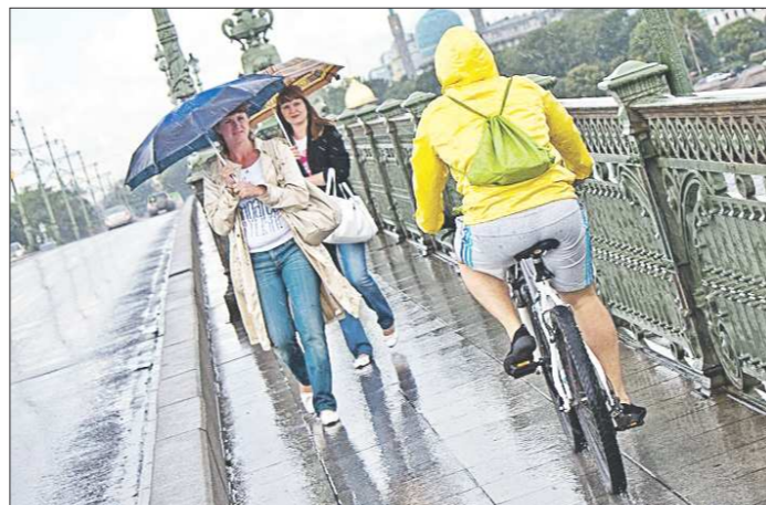
Езду по тротуарам велосипедисты объясняют тем, что велодорожек почти нет, а ездить по обочине им страшно