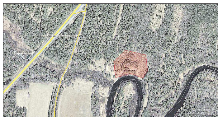
На снимке со спутника отчетливо видны контуры исчезнувшего Верхнетагильского городка