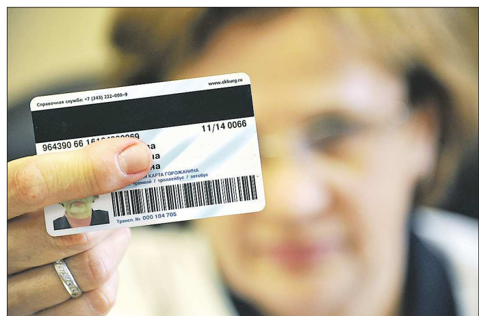
Социальные транспортные карты, выпущенные в 2009 году, пора заменить