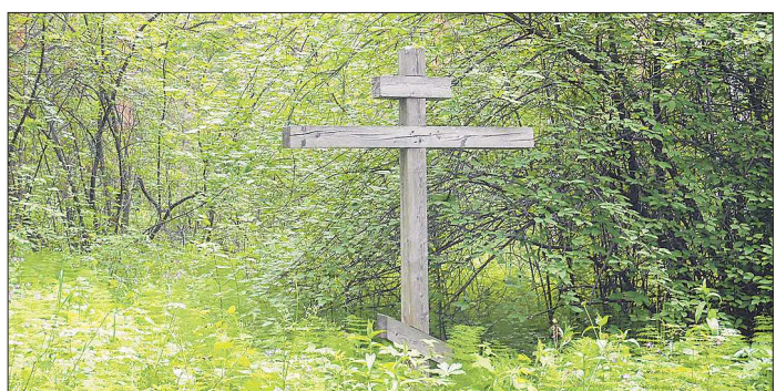
Случайный турист, наткнувшийся на этот крест, останется в недоумении — на нём нет никаких надписей и стоит он вдали от дорог, совершенно неприметный

Место, где стоял Верхнетагильский городок, нашли лишь в XVIII веке благодаря историку Герхарду Миллеру и его труду «История Сибири», изданной в 1750 году. Сам Миллер был учёным академическим и описание составлял с чужих слов, но уже в 1770 году приехавший на Урал с экспедицией академик Петер Симон Паллас разыскал и описал место, где стоял городок. Первые раскопки этого городка археологами начались в 1910 году, а в 1946 году им вплотную занялся известный московский археолог Отто Бадер, который обнаружил место вала и рва. Дальнейшие раскопки продолжились в 1952-м, 1977-м и 1981