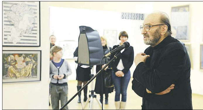
Одним из эпизодов фильма стала выставка к 85-летию художника, которая открылась в ноябре прошлого года в Музее ИЗО