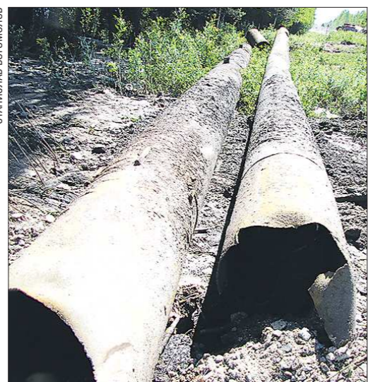
Почему уложили трубы неподходящего диаметра, теперь, наверное, и не узнать