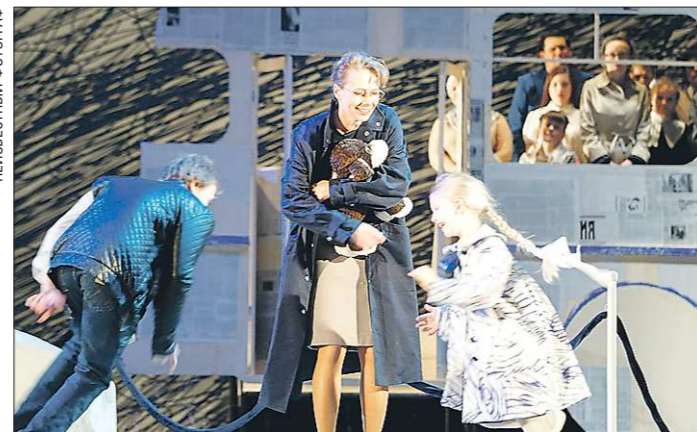
Самые трогательные сцены спектакля (особенно связанные с дочкой Машей) — это моменты жизни самого Довлатова. В основе повести — реальная история писателя