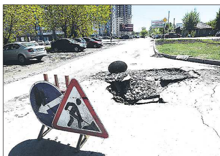
Строительство коммунальной сети, очевидно, «провалилось»