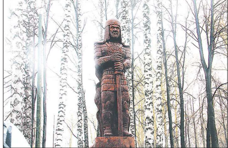
«Ростом» князь получился 2 метра 70 сантиметров. Высота деревянного постаamenta, на котором он стоит — 60 сантиметров