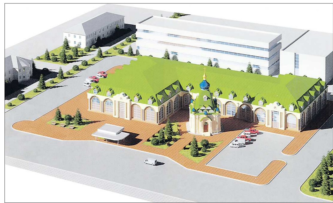
На эскизе торгового комплекса, который будет построен в центре Камышлова, видны традиционные элементы: арочные окна, лепнина, «пояса» по фасаду

По его словам, центр Камышлова преобразится уже через два года.