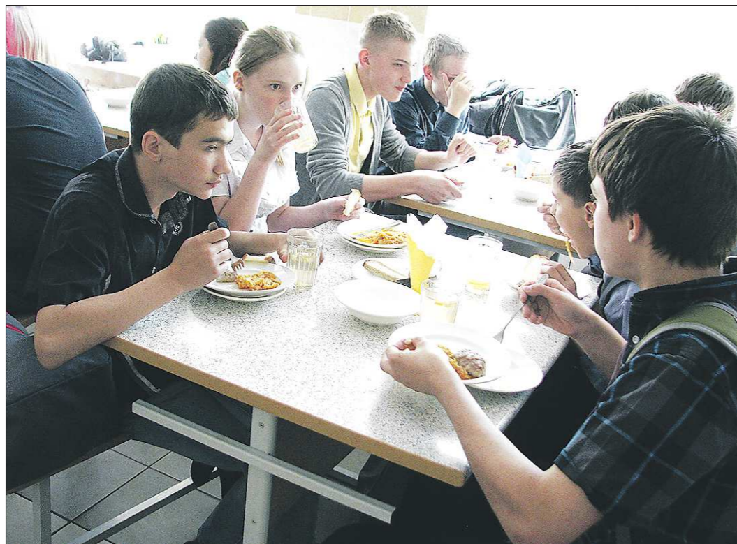
В прошлом году на переоснащение этой столовой тагильской школы № 44 город выделил 21 миллион рублей. Пищевые блоки перенесли с цокольного этажа на первый, закупили новую технику. Чуть ранее из подвалов «вытащили» столовые ещё четырёх тагильских школ