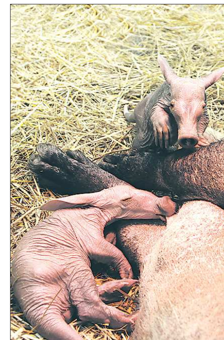
Пока двойняшки трубоккубы слишком маленькие, определить их пол невозможно. Поэтому имена ещё не выбраны