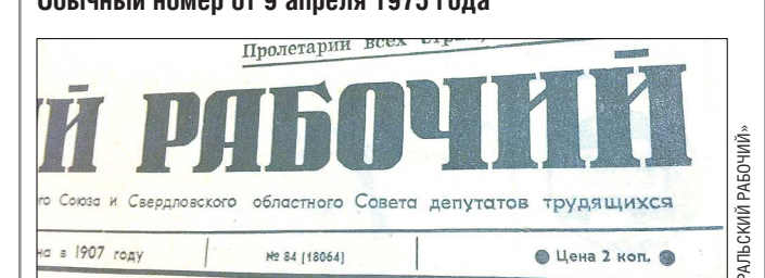
Четверговый номер от 10 апреля 1975 года. Обратите внимание на заштрихованные кружки вокруг надписи «Цена 2 коп.» — это и есть «чёрные метки»