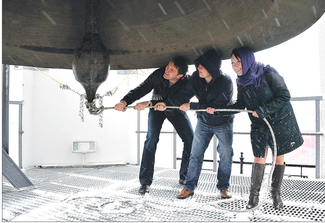
Колокол Большой Златоуст весит 16 тонн, а его язычок - 800 килограммов. В одиночку с таким не справиться

Несмотря на то что храмы не дают специальных объявлений, в Пасху обычно отбоя нет от желающих позвонить в колокола. Так, в среду на звонницу церкви Вознесения Господня выстроилась целая очередь: по узкой винтовой лестнице, прорубленной в стене храма, не побоялись подняться ни мамы с маленькими детьми, ни старики.