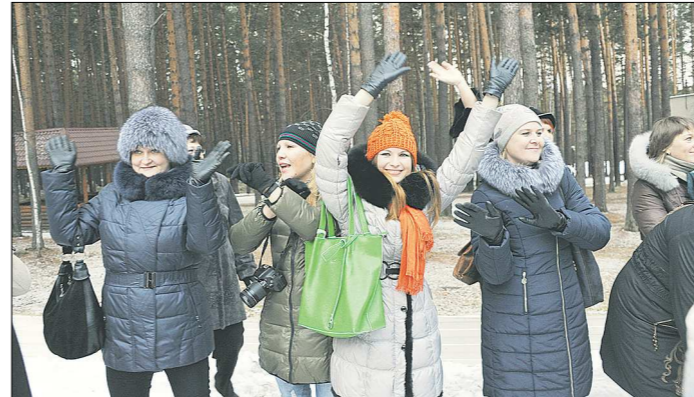
Типичная картина — большая часть женщин из группы одета в чёрное и серое. И лишь одна — в цветное