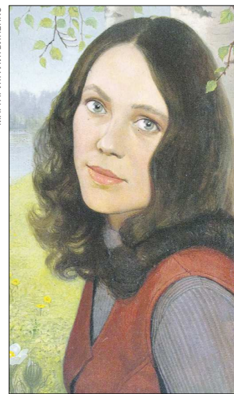
Это самый первый портрет второй жены художника, с которой они вместе почти 40 лет