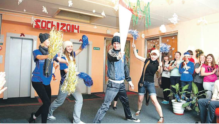
В дни Олимпиады студенты РАНХиГС украсили своё общежитие соответствующей символикой и проводили свои мини-игры