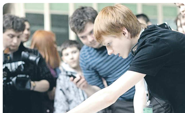
Уральский фестиваль робототехники, прошедший в рамках ежегодной выставки «Образование от А до Я», длился три дня. В нём приняло участие более 500 школьников из разных территорий области. Лучшими выбрали в 15 видах соревнований, среди которых были гонки и даже «гладиаторские бои» роботов. Кстати, на поле вывели не только роботов, сделанные из деталей «Лего», но и самодельки, сделанные из подручных материалов. Среди победителей разыграли семь путевок во всероссийский детский лагерь «Орлёнок», стоимость каждой из них порядка 40 тысяч рублей.