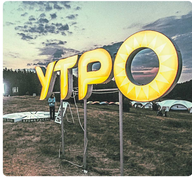
В этом году на форуме появится новая смена «Урал международной», в рамках которой будут проходить парламентские дебаты и лекции о молодёжной политике разных стран